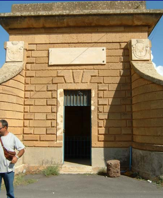
2500 \text{ m}^3 Giallonghi

La capacità di accumulo è pari a 3.000 \text{ m}^3 + 1.500 \text{ m}^3 in costruzione (Serbatoio Dimina).