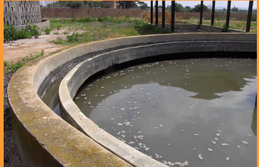
Via Errante Vecchia