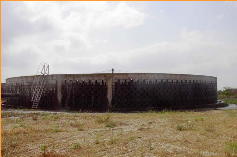
Via Errante Vecchia

Sono stati progettati per 42.000 A.E. e non sono adeguati alla 152/99.