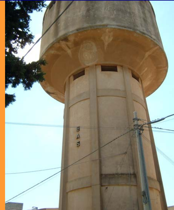
300 \text{ m}^3 Marinella