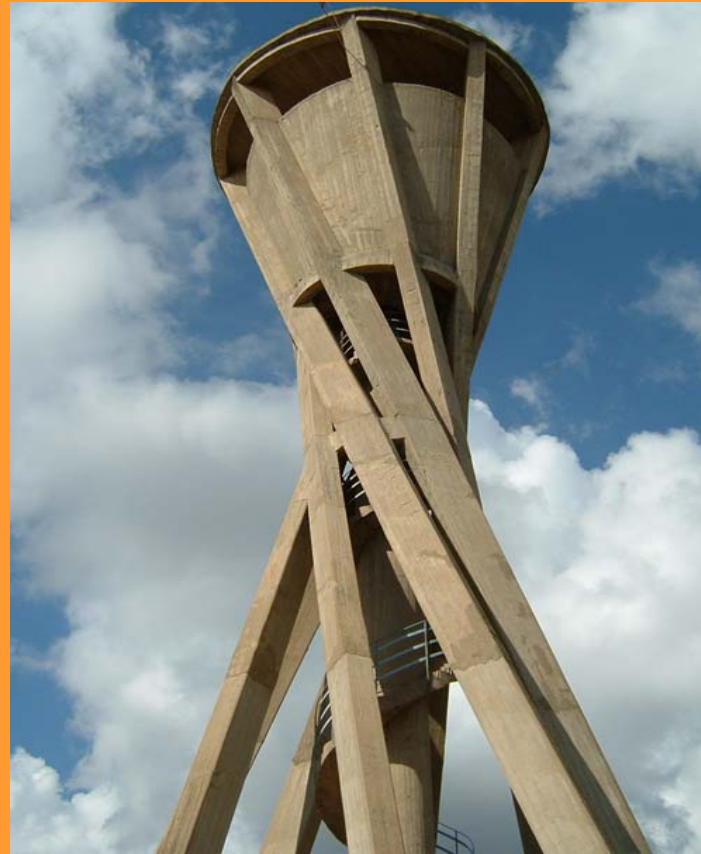
100 \text{ m}^3 Pens. Giallonghi