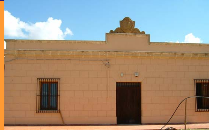
4000 m 3 Sotana