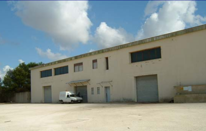
7000 m 3 Sinubio

La capacità di accumulo è pari a 23.030 m 3 . Di questi ne vengono usati 22.670.