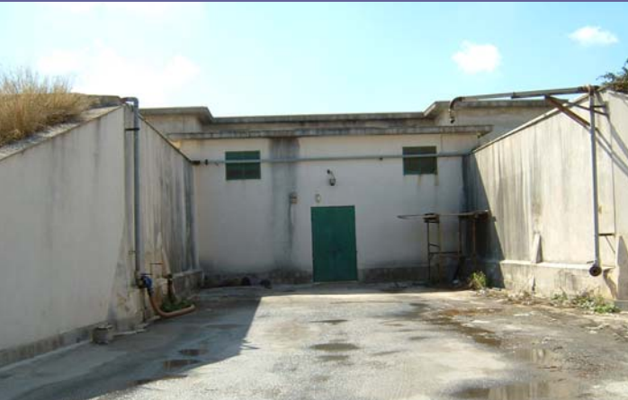
9000 m 3 Cardilla