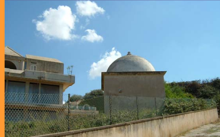
10 m 3 San Filippo