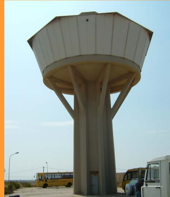
200 m 3 Pensile