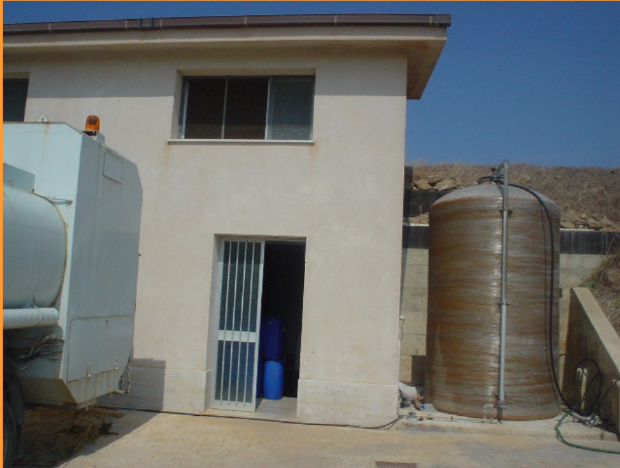
1000 m 3 Cittadino

La capacità di accumulo è pari a 1.200 m 3 .