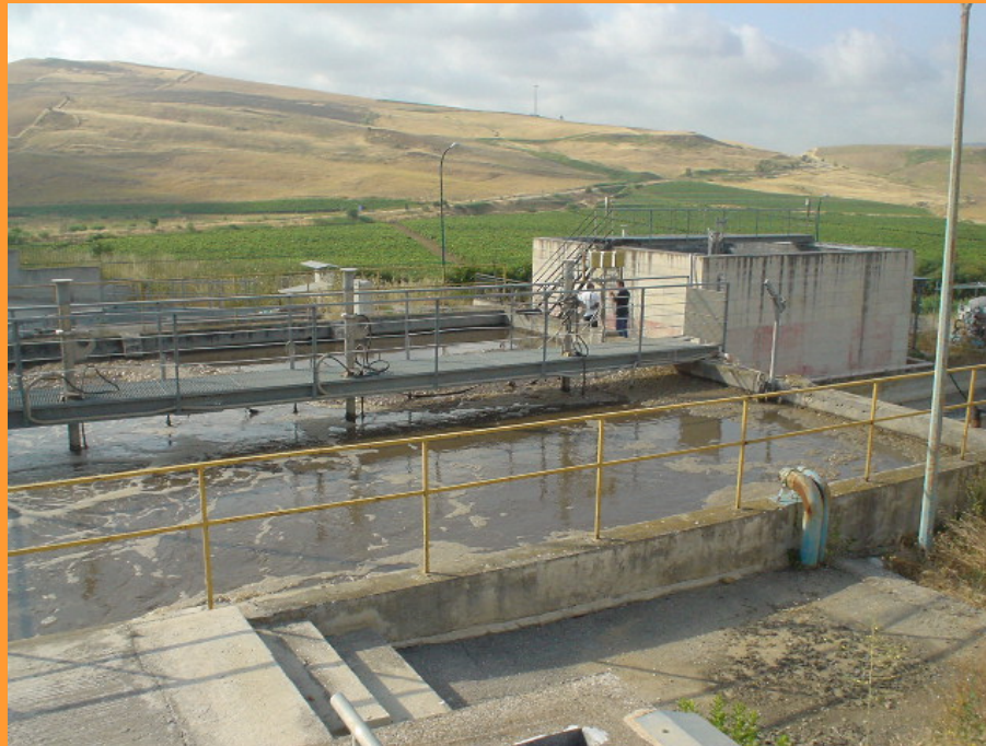
Impianto di depurazione

È stato progettato per 2.000 A.E. ed è adeguato alla 152/99.