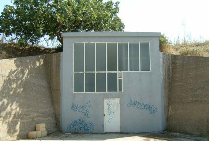
3000 m 3 Crispella

La capacità di accumulo attuale è pari a 3.900 m 3 .