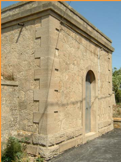
700 m 3 Molo Vecchio