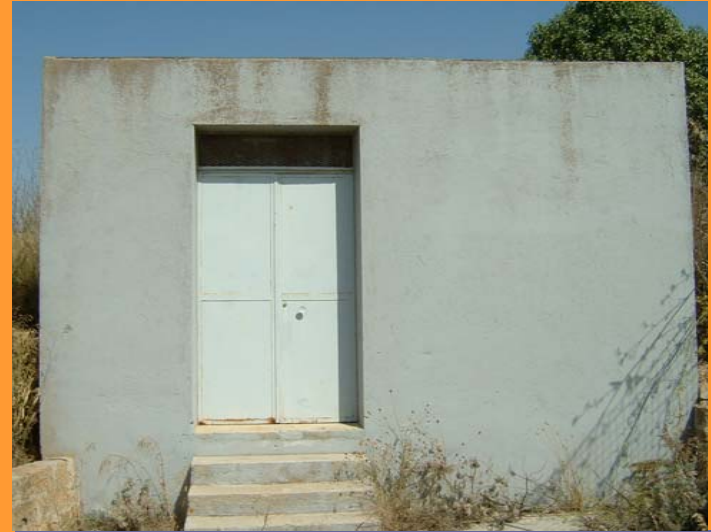
200 m 3 Molo Nuovo