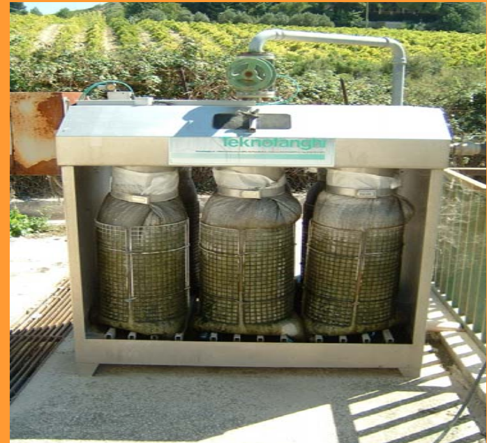
Impianto di depurazione