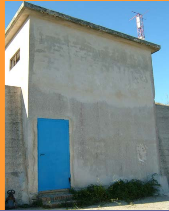
500 m 3 Ugo La Malfa